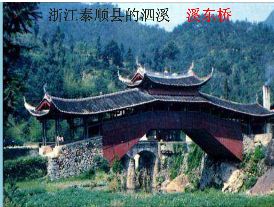
浙江泰顺县的泗溪 溪东桥