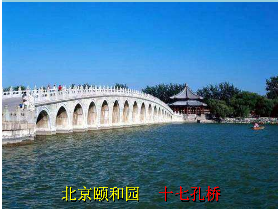
北京颐和园 十七孔桥