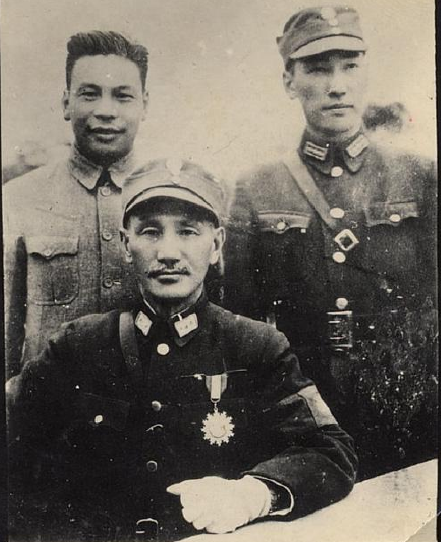
蔣主席暨經國緯國二公子於重慶